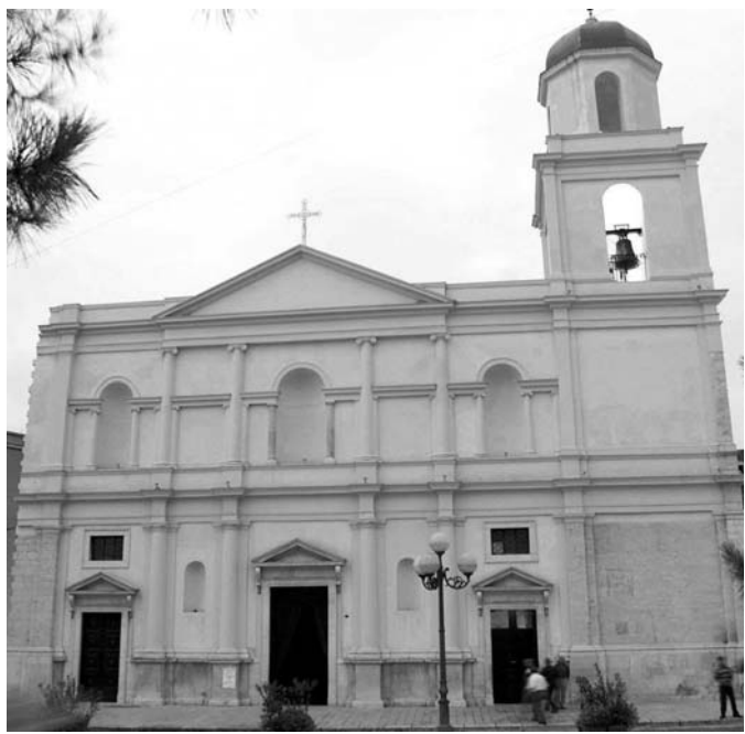
AL CENTRO DELLE CELEBRAZIONI. La cattedrale di San Sabino

Domani le celebrazioni solenni e la restituzione del crocifisso del XIII secolo